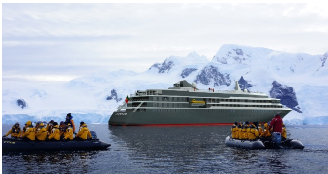
Expeditionsreisen mit WORLD EXPLORER

Die Kooperation mit dem führenden Anbieter für Polar-Kreuzfahrten, Quark Expeditions, auf WORLD EXPLORER wird für 2020 erweitert: Zusätzlich zu der 15-tägigen Antarktisreise, die in der argentinischen Stadt Ushuaia startet und über die südlichen Shetlandinseln und die Antarktische Halbinsel führt, sind