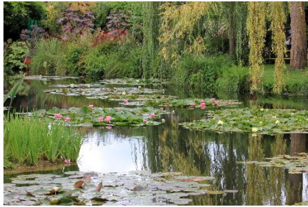
GARTEN IN GIVERNY

Ein französischer Chanson-Abend wartet an Bord, bevor MS SEINE COMTESSE am nächsten Morgen, mit dem Rücken zur Küste, weiter nach Rouen gleitet. Die Geburtsstadt von Gustave Flaubert lebt von Kontrasten: zum einen gotische Bauwerke, altes Fachwerk und Kirchen im Zentrum und zum anderen hohe Hafenkranne am Ufer der Seine. Die Hauptstadt der nordfranzösischen Region wird auch als „die Stadt der hundert Kirchtürme“ bezeichnet. Imposante Ruinen ziehen Besucher in ihren Bann und sind ein Zeugnis romanischer Baukunst.