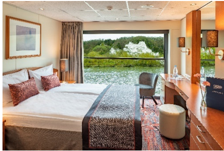
DELUXE OBERDECK KABINE

Bei einer Reisegeschwindigkeit von 16 – 18 Stundenkilometer können sich die