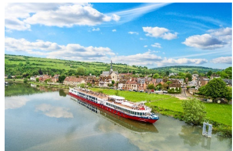
MS SEINE COMTESSE

Ob Edith Piaf, Claude Monet oder Picasso – sie alle ließen sich von Frankreichs magischem Norden inspirieren. Keine einzige Facette dieser faszinierenden Schönheit lässt die Seine auf ihrer Reise in Richtung Atlantikküste aus. Sie fließt vorbei an tiefgrünen Wiesen und hin zu kalkweißen Hochufeln. Zwischen Paris und der beeindruckenden Küste der Normandie liegen 375 reizvolle Kilometer auf dem Wasser: Reisehungrige können den Spätsommer mit einer Flusskreuzfahrt durch die Geschichte Frankreichs genießen.